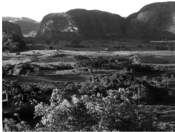
Figura 2. Valle y mogotes de Viñales, Pinar del Rió, patrimonio natural paisajístico de la geología cubana