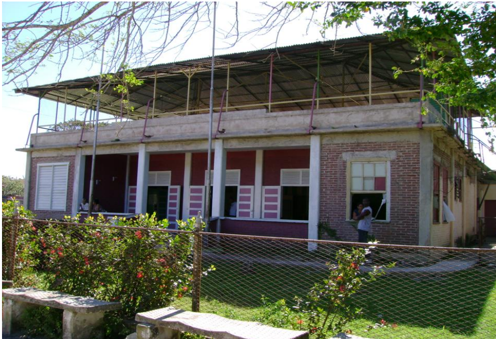
Anexo #8 Antigua oficina del trafico de trenes del central, actualmente Museo de Historia.